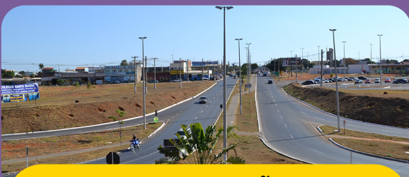
ADMINISTRAÇÃO DE SANTA MARIA