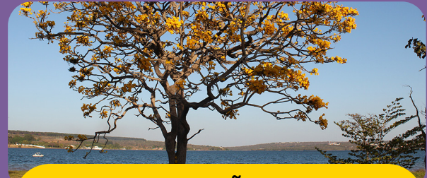
ADMINISTRAÇÃO DO LAGO NORTE