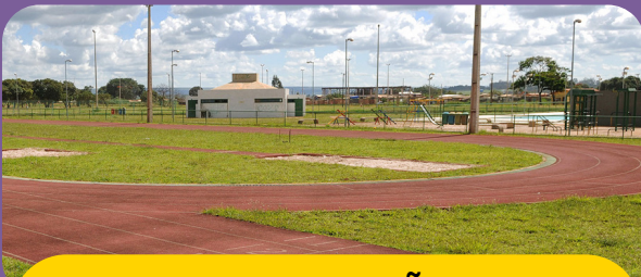
ADMINISTRAÇÃO DA ESTRUTURAL