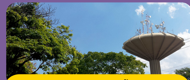
ADMINISTRAÇÃO DE CEILÂNDIA