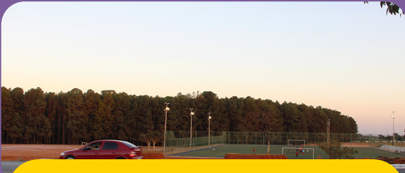
ADMINISTRAÇÃO DO ITAPOÃ