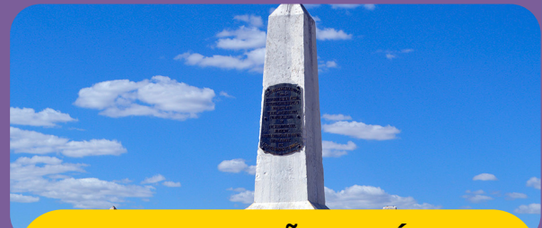
ADMINISTRAÇÃO DE ÁGUAS CLARAS