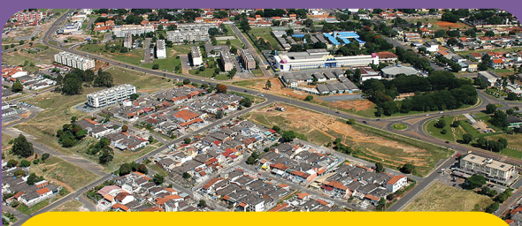
ADMINISTRAÇÃO DE SOBRADINHO